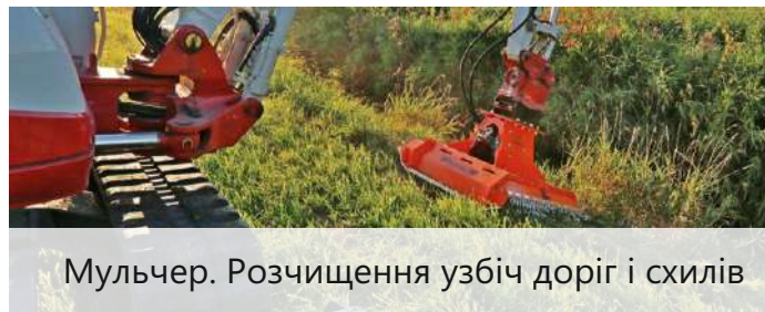
Мульчер. Розчищення узбіч доріг і схилів