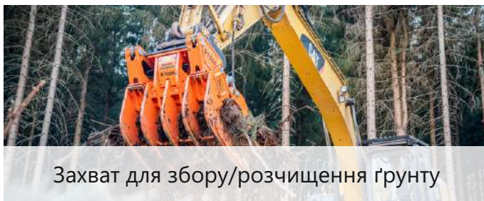
Захват для збору/розчищення ґрунту