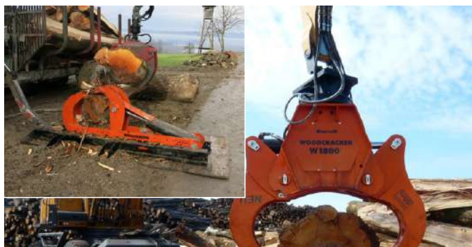
Розколювачі деревини великих діаметрів