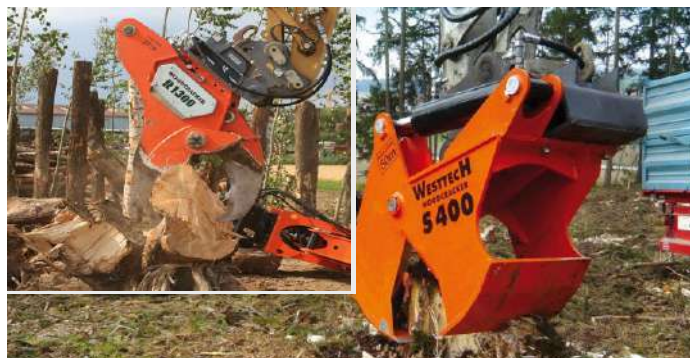
Захвати для обрізки пеньків під корінь та вилучення кореня із ґрунту