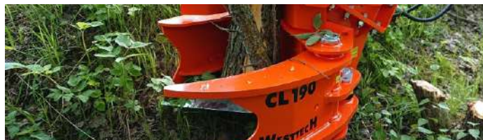
Різання невеликих дерев і чагарників