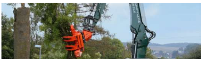
Прибирання дерев в межах міста